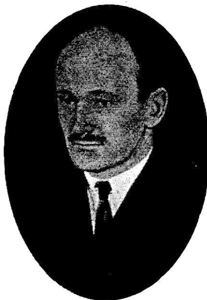
Valsts kases pārvaldnieks, Valsts kases departamenta direktors no 1919.-1922. gadam