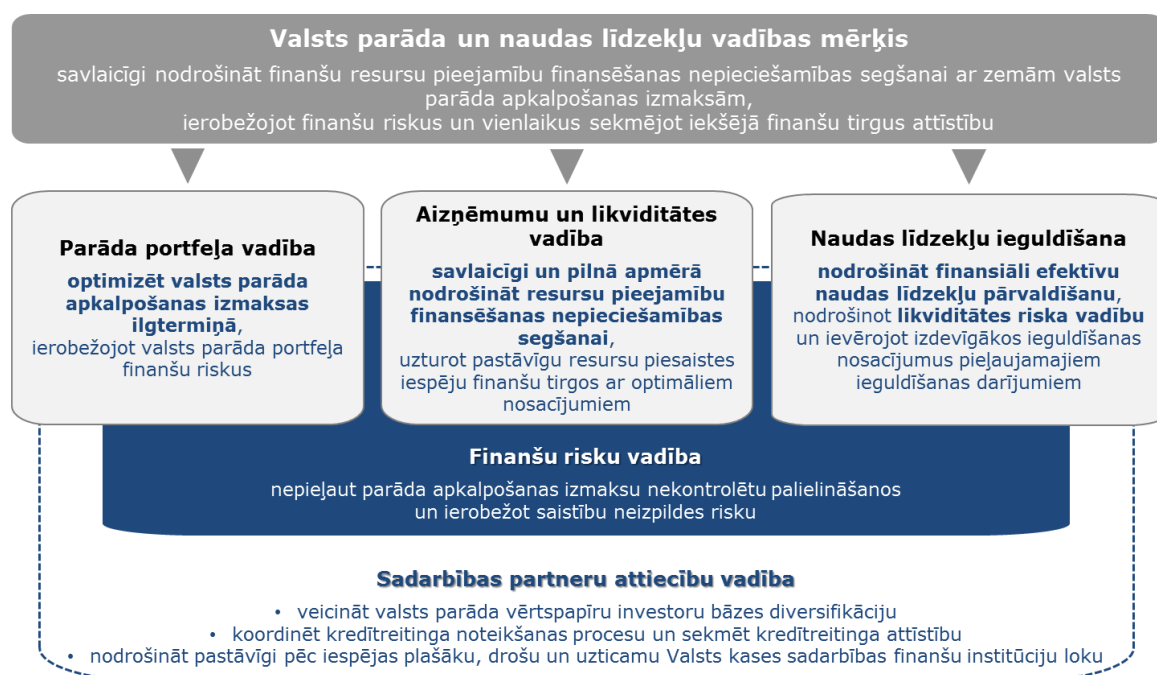
3.attēls. Valsts parāda un naudas līdzekļu vadības stratēģija

Kopējās finansēšanas nepieciešamības segšanai kārtējā gadā plānotos pasākumus un finansēšanai piemērotāko aizņēmšanās instrumentu izvēli nosaka Resursu piesaistīšanas pasākumu plāns vidējam termiņam , kuru, ņemot vērā Valsts parāda vadības stratēģijā noteiktās vadlīnijas, izstrādā Valsts kase un apstiprina finanšu ministrs.