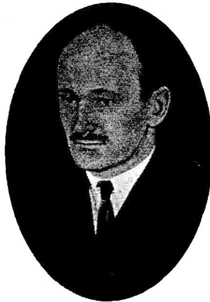
Valsts kases pārvaldnieks, Valsts kases departamenta direktors no 1919.-1922. gadam